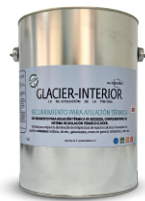
Galón de 3,7 L