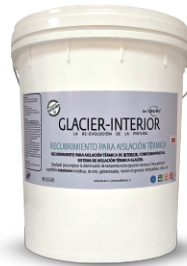
Tineta de 19 L